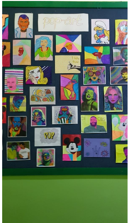
Mentorica: Jelka Flis